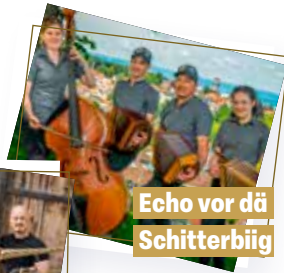
Echo vor dä Schitterbiig