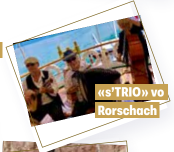
«s'TRIO» vo Rorschach