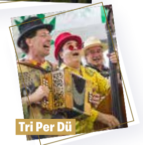
Tri Per Dü