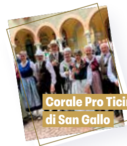
Corale Pro Ticino di San Gallo